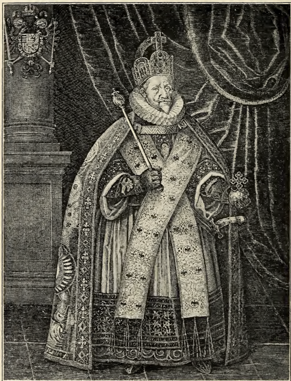
THE EMPEROR FERDINAND II.